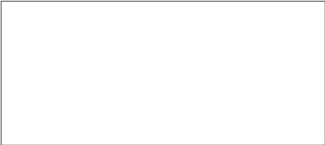
Εικόνα 1. Όψη του κτιρίου του Τμήματος .....